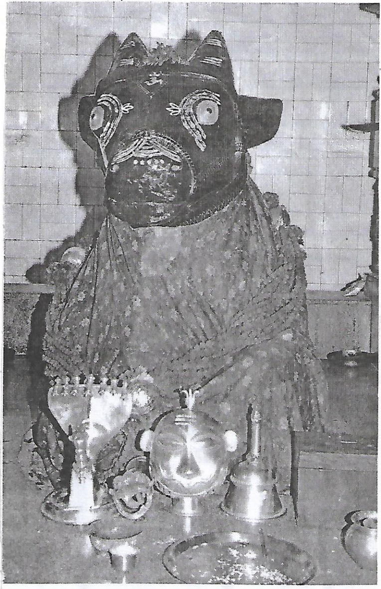
ನಂದಿ ಮೂರುತಿ ಊರ್ಘ್ ಬಸವಣ್ಣ